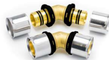
PRENSAR MULTIPINÇA MULTIJAW PRESSFITTING