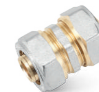
COMPRESSÃO LATÃO BRASS COMPRESSION