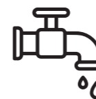
REDES DE ÁGUA QUENTE E FRIA SOB PRESSÃO POTABLE WATER APPLICATION