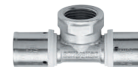
PRENSAR LATÃO BRASS PRESSFITTING