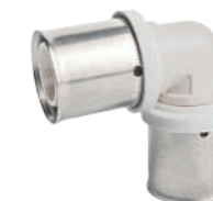
PRENSAR PPSU PPSU PRESS